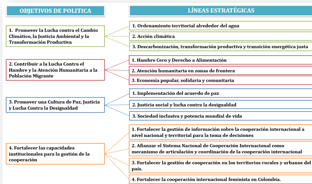
Tabla 2. Objetivos y Líneas Estratégicas de la ENCI 2023. 2026

Por último, es importante resaltar que la alineación de la ENCI 2023-2026 apunta a la gestión y aportes al cumplimiento de los Objetivos del Desarrollo Sostenible (ODS) 6 .