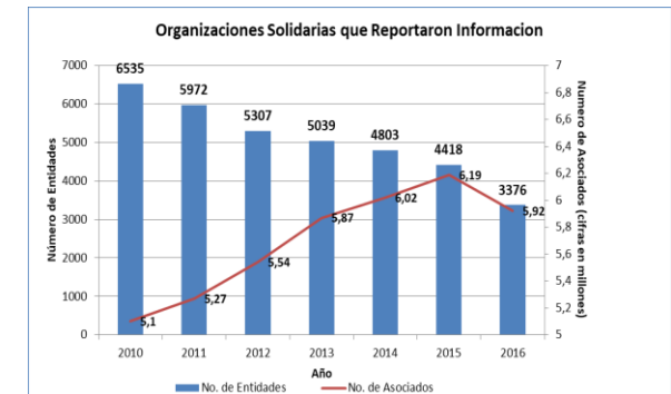
Gráfico 1: N° Organizaciones solidarias que reportaron información, período 2010 – 2016.

Actualmente están en período de reporte de información con corte a 31 de diciembre de 2016, por lo que se presentan cifras parciales, que además se ven algo disminuidas, debido a que por la adopción de los nuevos formatos para el reporte de información financiera bajo las Normas Internacionales de Información Financiera, se extendió el plazo de reporte a partir del 1º de marzo.