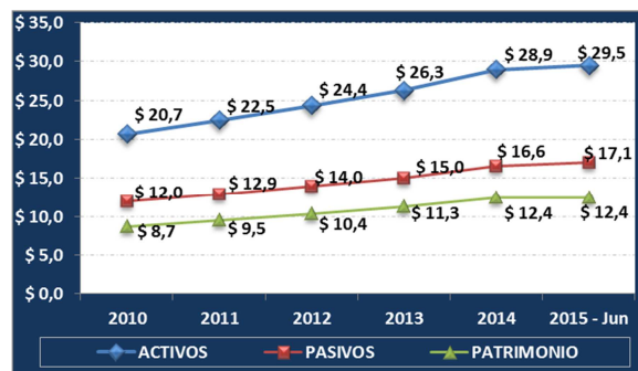
Gráfico 3: Cuentas financieras de las organizaciones solidarias, período 2010-2014 (cifras en billones)

patrimonio se incrementó en un 43% , puesto que paso de $8,7 billones en 2010 a $12,4 billones en el 2015.