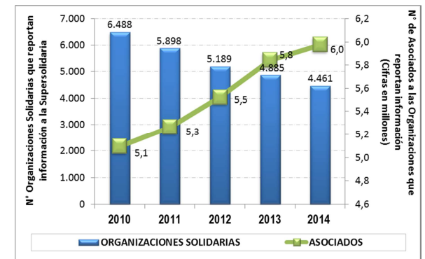
Gráfico 2: N° Organizaciones solidarias que reportan información, período 2010 - 2014.

La supervisión que ejerce la Entidad, incluye las funciones de vigilancia, inspección y control, desarrolladas por la Delegatura para la supervisión de la actividad financiera, que realiza supervisión de manera permanente, mientras que la Delegatura para la supervisión del ahorro y la forma asociativa ejerce supervisión en forma aleatoria. Conjuntamente, las 4.461 organizaciones vigiladas reportan al cierre de 2014 , más de 6 millones de asociados y la generación de más de 83 mil empleos directos.