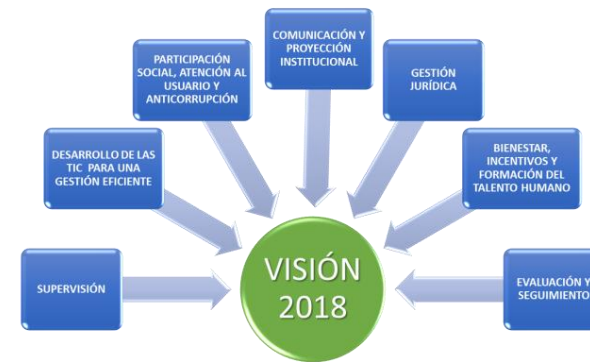
Gráfica N° 3: Líneas de acción estratégicas establecidas del Plan Estratégico Institucional 2014-2018

“Supervisión para el crecimiento social y económico del sector solidario”