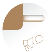
Espacios o Mecanismos de diálogo