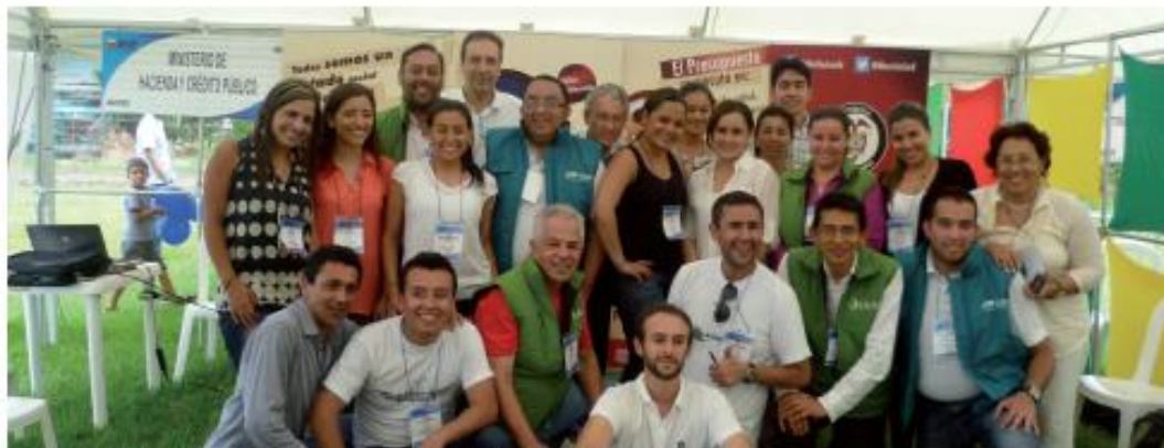
Grupo Sector Hacienda en la Feria Nacional del Servicio al Ciudadano, San José del Guaviare.

Financiera, Previsora y Positiva Seguros, Central de Inversiones S.A., la Dirección de Impuestos y Aduanas Nacionales, así como el Inspector General de Tributos, Rentas y Contribuciones Parafiscales, brindaron asesoría a los/as asistentes sobre los servicios que presta el Estado a la ciudadanía.