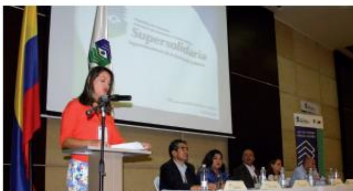
Jornada de Supervisión Descentralizada, Barranquilla. 17 de Julio de 2013.