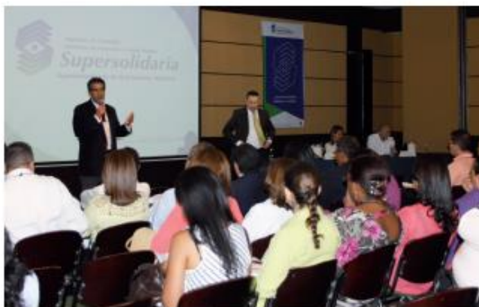
Jornada de Supervisión Descentralizada, Bogotá. 17 de Julio de 2013.

Las Jornadas Descentralizadas amplían la cobertura de supervisión y aseguran una adecuada administración de las cooperativas, fondos de empleados y mutuales, mediante un modelo de acercamiento al sector solidario por parte de directivos y