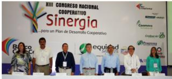
Instalación XIII Congreso Nacional Cooperativo, Cartagena 2013

Asimismo, invitó a los asistentes a seguir adelante con optimismo y compromiso. “Con el aporte de millones de cooperativistas de nuestro país vamos a alcanzar esa Colombia justa, moderna y segura que merecemos y que merecen nuestros hijos”, señaló el presidente Santos.