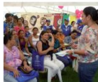
Feria Nacional del Servicio al Ciudadano, San José del Guaviare

Durante las jornadas, la Superintendencia de la Economía Solidaria, la Unidad de Gestión Pensional y Parafiscales, la Superintendencia