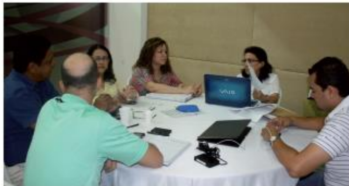
Jornada de Supervisión Descentralizada, Barranquilla. 17 de Julio de 2013.