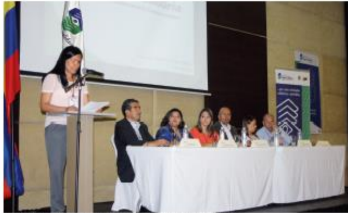
Jornada de Supervisión Descentralizada, Barranquilla. 17 de Julio de 2013.

Así, la entidad rectora del sector solidario en Colombia, impone un modelo de gestión al servicio de sus clientes, que dispone de módulos de atención de consultas, peticiones, quejas y reclamos y un centro de soporte técnico para el reporte de estados financieros, durante los tres días que en promedio dura cada jornada. Y, avanza en la estrategia de fortalecimiento y modernización del sistema financiero y del mercado de capitales, establecida en el Plan Nacional de Desarrollo (PND).