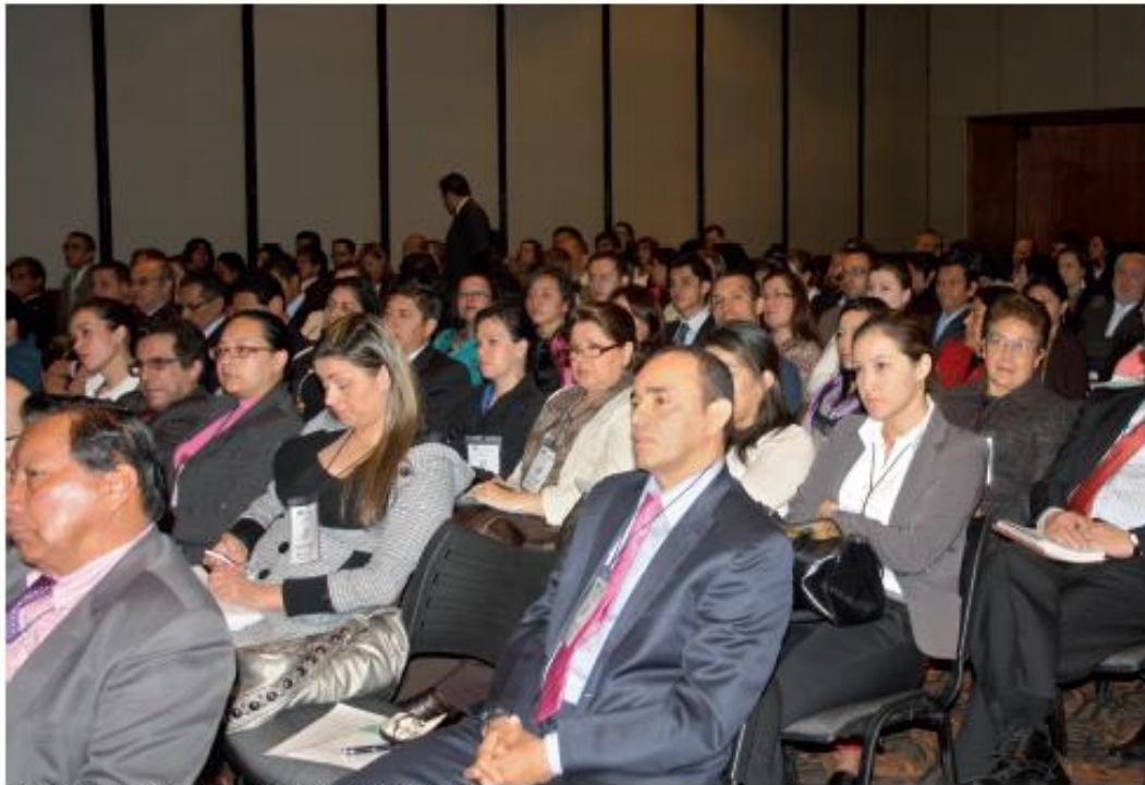
Jornada de Supervisión Descentralizada, Bogotá. 19 de junio de 2013.

Por Oficina de Comunicaciones Supersolidaria