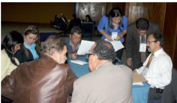
Jornada de Supervisión Descentralizada, Bogotá. 19 de Junio de 2013.