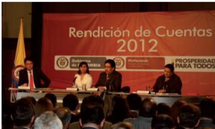
Rendición de Cuentas 2012.

Sobre la fecha de la realización de la Audiencia Pública de Rendición de Cuentas 2013, la información correspondiente estará publicada en el portal web de la Superintendencia.