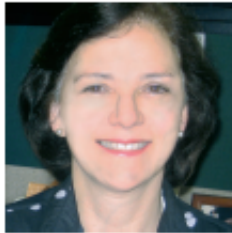
Por CLAUDIA FRANKY SILVA Profesional Especializado de la Oficina de Asesoría Jurídica

Las cooperativas son empresas asociativas sin ánimo de lucro, en las cuales los trabajadores y/o usuarios, son simultáneamente aportantes y gestores de la empresa, creada con el objeto de producir o distribuir conjunta y eficientemente bienes o servicios para satisfacer las necesidades de sus asociados y de la comunidad en general.