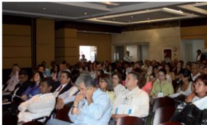
Jornada de Supervisión Descentralizada, Cali. 3 de Julio de 2013.