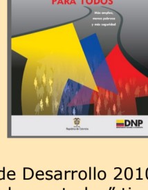
Plan Nacional de Desarrollo 2010—2014

Después de este consenso, el sector presentará un documento formal al Gobierno y al Congreso para que sea tenido en cuenta en la discusión legislativa del Plan Nacional de Desarrollo.